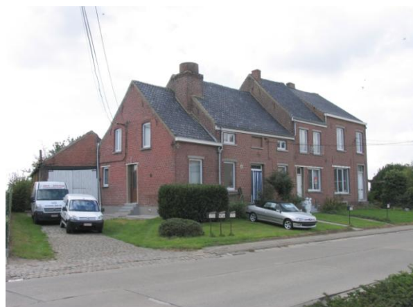
De oude kamme (vroeger) .....en nu