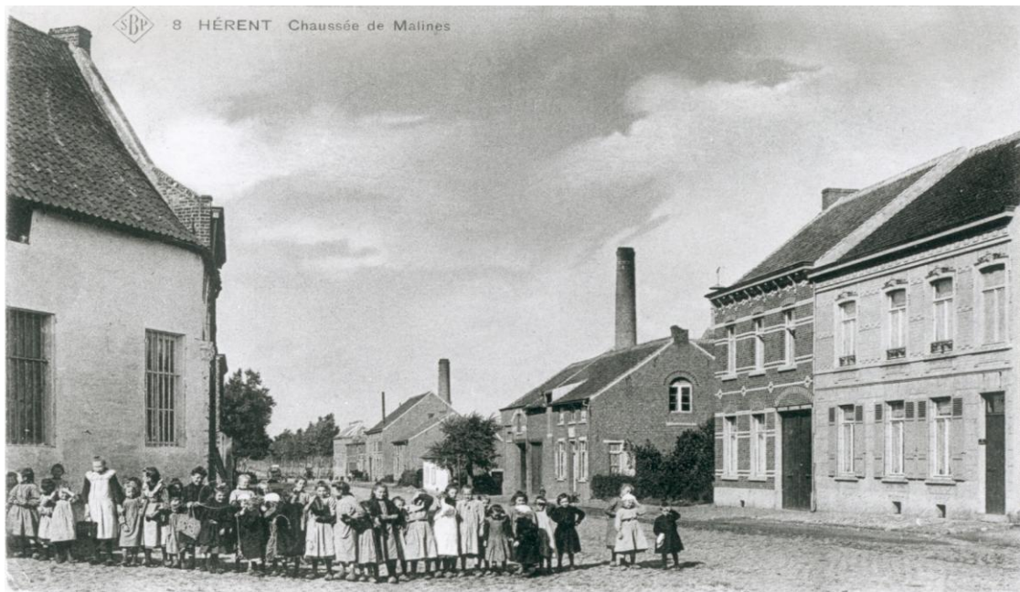
De schouw vooraan is van de St-Jozefbrouwerij, de schouw achteraan van de brouwerij De Hertogh